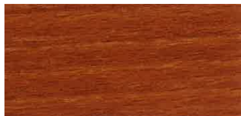
EW 011 - 20