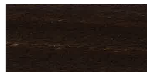
EW 081 - 10