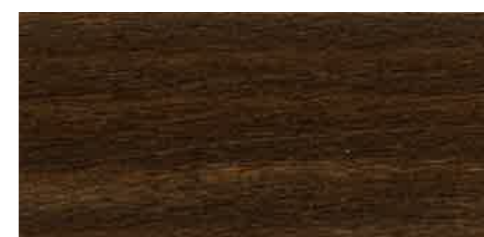
EW 061 - 10