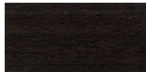
EW 091 - 20