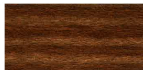
EW 071 - 20