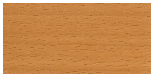
EW 001 - 20