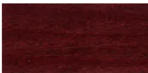
EW 031 - 10

SI EKOHEL lužila W so izdelana na vodni osnovi in so okolju ter uporabniku prijazna. Primerna so za luženje vseh vrst lesa; površino lesa obarvajo, strukturo lesa pa ohranijo vidno.