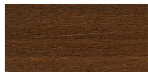
EW 061 - 20