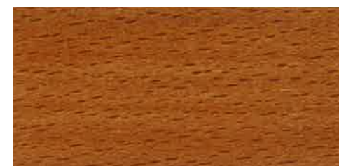
EW 041 - 10