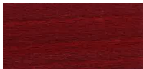
EW 031 - 20