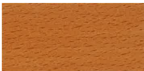
EW 001 - 10