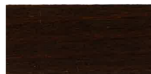
EW 071 - 10