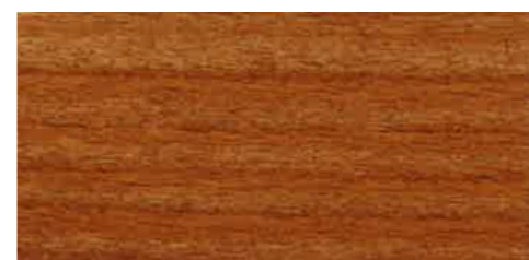
EW 051 - 20