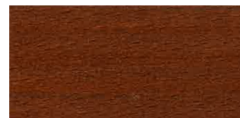
EW 051 - 10