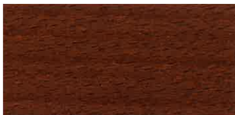
EW 011 - 10