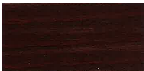
EW 021 - 10